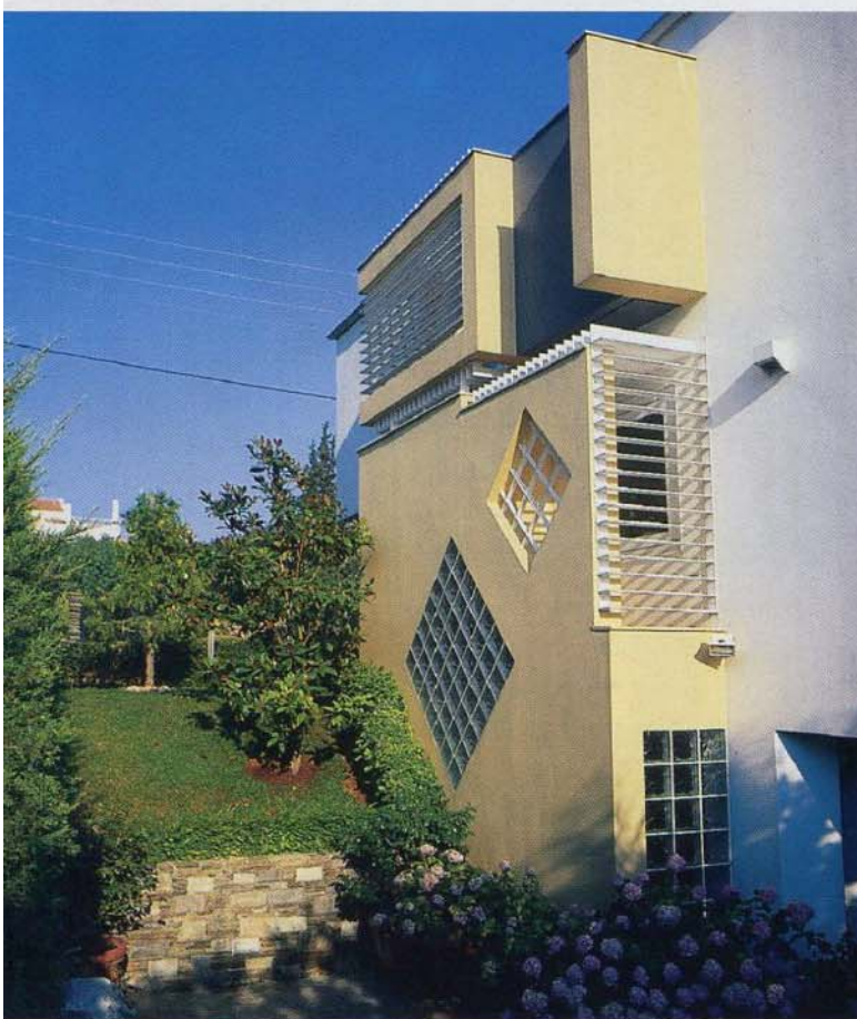
Αριστερά. Λεπτομέρεια του εξωτερικού του σπιτιού. Το λευκό και κίτρινο χρώμα της όψης δένουν αρμονικά με το άφθονο πράσινο του κήπου.

βρισκόταν ακριβώς στη συμβολή των οδών Ρόδου και Γούναρη με πρασιές πέντε μέτρων, είχε σχετικά μικρή επιφάνεια (700 τ.μ.) και οι ιδιοκτήτες του επιθυμούσαν έναν υπαίθριο ιδιωτικό χώρο με πισίνα. Η είσοδος του σπιτιού τοποθετήθηκε ακριβώς στη συμβολή των δύο πλευρών αυτού του σχήματος Γ, φέρνοντας πάλι στο προσκήνιο "ξεχασμένες" αρχιτεκτονικές λύσεις, που στο παρελθόν ήταν συχνά δοκιμασμένες και πετυχημένες. Ο όγκος του κτιρίου προεκτείνεται πάνω από την είσοδο και μ' αυτό τον τρόπο δημιουργείται ▶