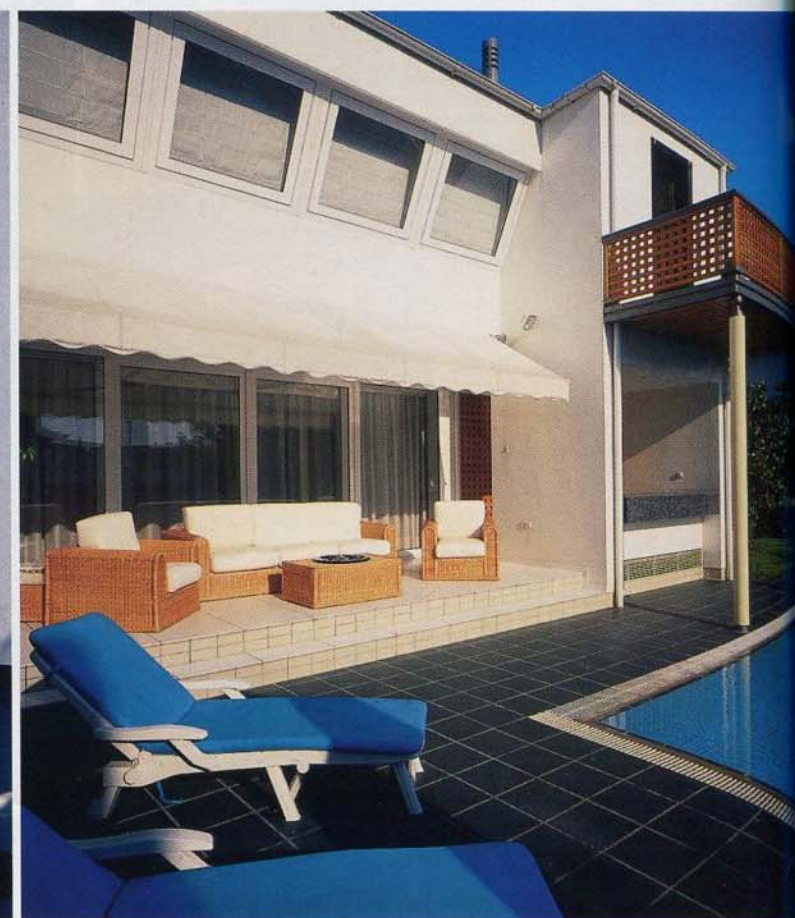
Απέναντι κάτω αριστερά Κοντινό πλάνο του σπιτιού. Τα κεκλιμένα παράθυρα από λευκό PVC βλέπουν προς την πισίνα και την αυλή και συγχρόνως περιορίζουν τον ενοχλητικό δυτικό ήλιο.